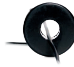
Solar-Log™ CT 100 A-c