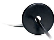
Solar-Log™ CT 16 A