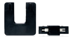
Solar-Log™ CT 100 A-o