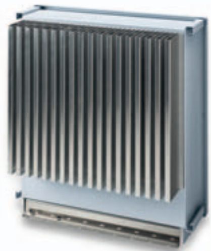
Äußerst robust: SINVERT PVM Wechselrichter verzichten auf externe Lüfter.